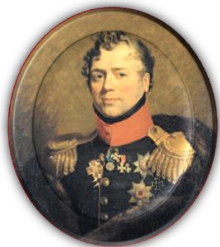
Князь Д.В. Голицын

О генерале Андрее Ивановиче Гудовиче (1781-1867).